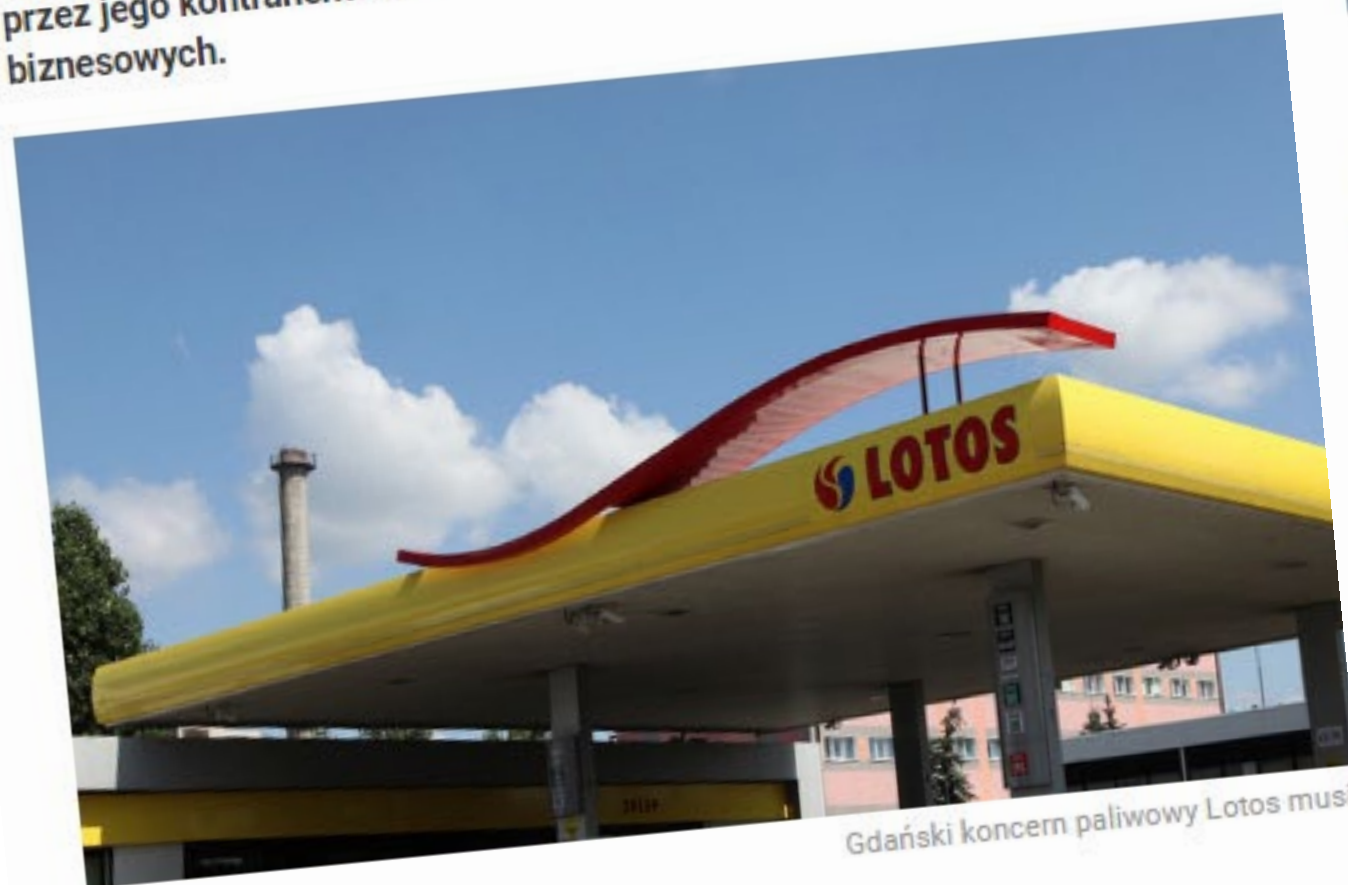
Gdański koncern paliwowy Lotos musi...

240 milionów złotych kary dla Lotosu. "Za kontrahentów" Czwartek, 15 października 2015 (13:30) Gdański koncern paliwowy Lotos musiał zapłacić 240 milionów złotych kary. Nie do zapłaty. Kontrola Skarbowej w Bydgoszczy. To kara za oszustwa podatkowe, ale nie dokonana przez jego kontrahentów. Skarbowka uznała, że koncern powinien prześwietlać biznesowych.